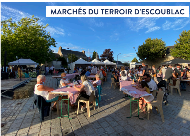
MARCHÉS DU TERROIR D'ESCOUBLAC