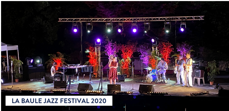
LA BAULE JAZZ FESTIVAL 2020