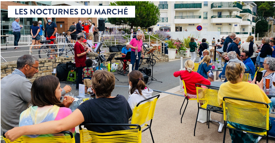
LES NOCTURNES DU MARCHÉ