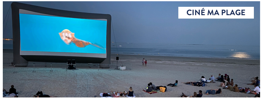
CINÉ MA PLAGE