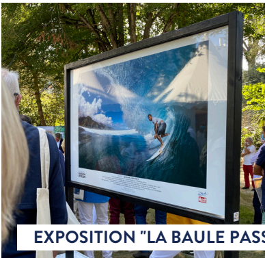
EXPOSITION "LA BAULE PASSION Océan"