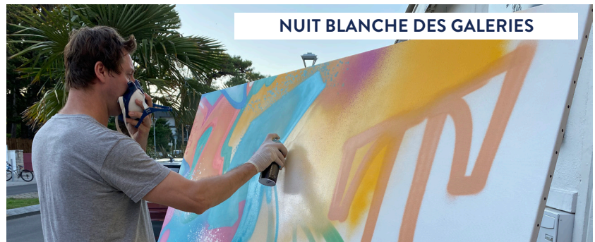
NUIT BLANCHE DES GALERIES