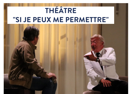
THÉÂTRE "SI JE PEUX ME PERMETTRE"