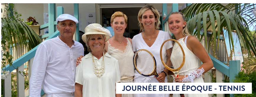
JOURNÉE BELLE ÉPOQUE - TENNIS