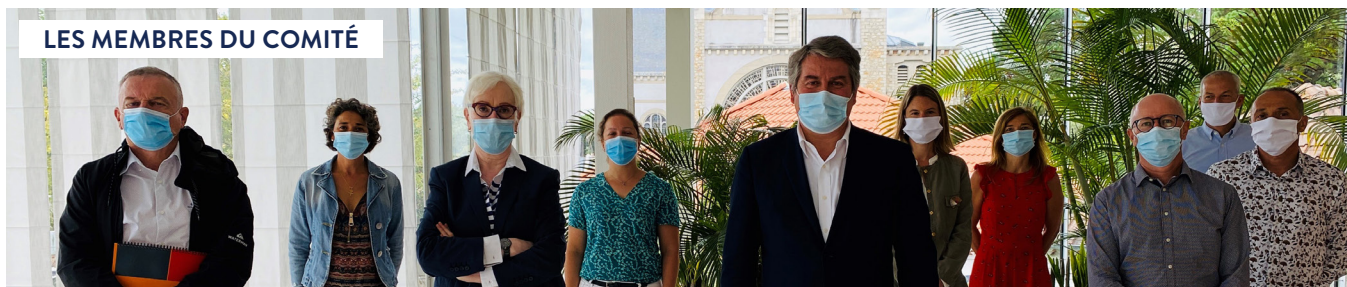
LES MEMBRES DU COMITÉ

Certes, cette compétence n'est que marginalement de la responsabilité des communes, mais les lignes sont en train de bouger et de plus en plus, les maires veulent contribuer à apporter des réponses aux préoccupations de la population sur ces sujets. Notre rôle sera d'être des contributeurs d'idées et des facilitateurs pour aider les élus à assumer cette nouvelle mission.