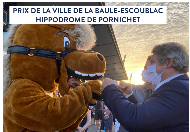
PRIX DE LA VILLE DE LA BAULE-ESCOUBLAC HIPPODROME DE PORNICHET