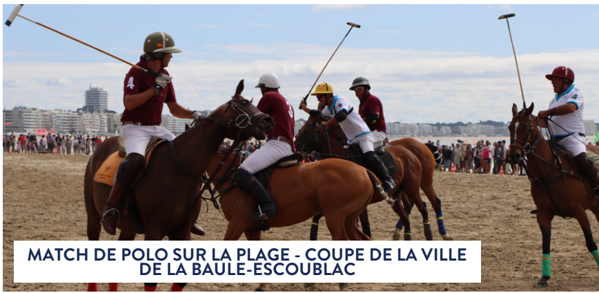
MATCH DE POLO SUR LA PLAGE - COUPE DE LA VILLE DE LA BAULE-ESCOUBLAC