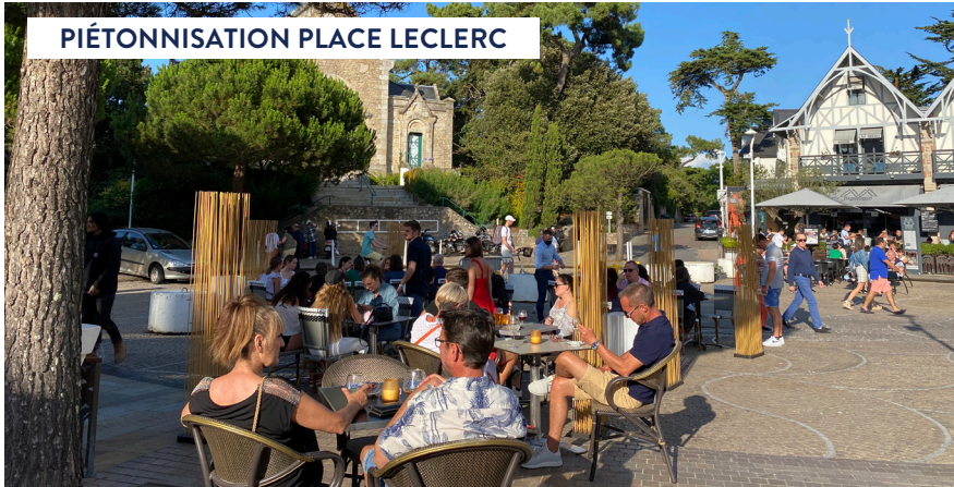
PIÉTONNISATION PLACE LECLERC