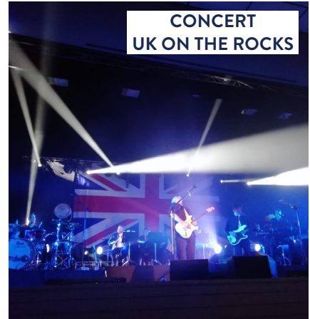
CONCERT UK ON THE ROCKS