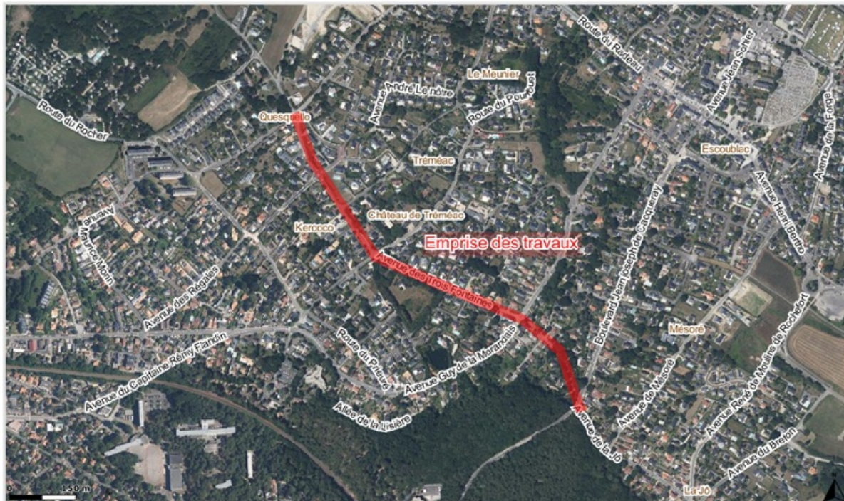
Emprise des travaux