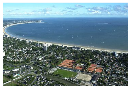
Schéma de Cohérence Territoriale (SCoT)

Le PPRL de la Presqu'île Guérandaise - Saint-Nazaire a été approuvé par arrêté du Préfet en date du 13 juillet 2016.